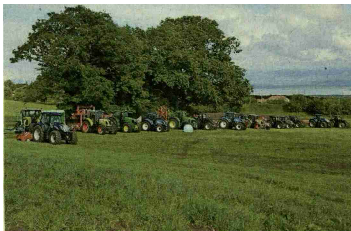
Des démonstrations de machines étaient organisées.