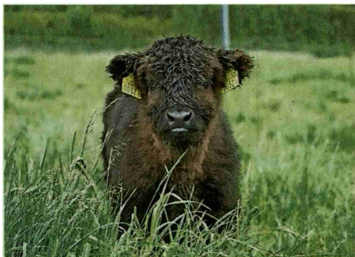
Beef.ch permet de présenter les races allaitantes.