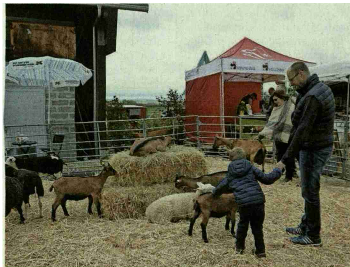
La caresserie, un succès pour petits et grands!