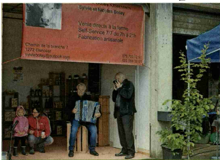
Les Bolay proposent un self-service à la ferme.